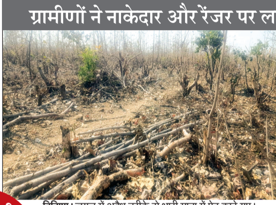
ग्रामीणों ने नाकेदार और रंजर पर लगाए गंभीर आरोप