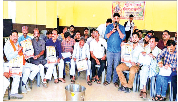
हरिभूमि न्यूज गंजबासोदा

रविवार को नगर में जगह जगह होली मिलन समारोह आयोजित किए गए। जिसमें विभिन्न कार्यक्रमों के अलावा समाजजनों एवं नागरिकों ने एक दूसरे को रंग गुलाल लगाकर होली एवं रंगपंचमी की शुभकामनाएं दीं। श्री रघुवंश परमार्थ सेवा ट्रस्ट द्वारा रविवार को रघुवंशी धर्मशाला में होली मिलन समारोह के साथ-साथ रामनवमी की तैयारियों को लेकर बैठक आयोजित हुई। इस अवसर पर आगामी रामनवमी महोत्सव के कैलेंडर का विमोचन किया गया और समाज के लोगों ने एक दूसरे को रंग-गुलाल लगाकर रंग पंचमी की शुभकामनाएं दीं। बैठक के दौरान रामनवमी के आयोजन को भव्य बनाने और शोभायात्रा में महिलाओं की भागीदारी सुनिश्चित करने पर भी सहमति बनी। बैठक की शुरुआत भगवान श्रीरामचंद्र जी की प्रतिमा