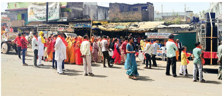
हरिभूमि न्यूज कुरवाई

साहू समाज की आराध्य देवी मां कर्मा देवी की जयंती के अवसर पर कुरवाई नगर में रविवार को भव्य शोभायात्रा निकाली गई। कार्यक्रम का शुभारंभ विधिविधान से पूजा-अर्चना कर किया गया, जिसमें समाज के वरिष्ठजन, महिलाएं, युवा और बच्चे बड़ी संख्या में शामिल हुए। शोभायात्रा मुरलीधर मंदिर प्रांगण से प्रारंभ होकर मुख्य बाजार, बस स्टैंड सहित नगर के विभिन्न मार्गों से होती