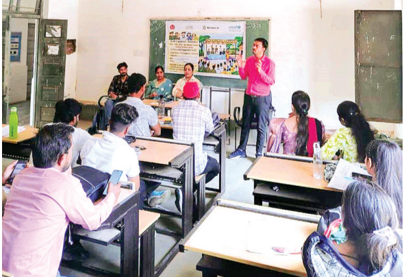
हरिभूमि न्यूज गंजबासोदा

ब्लॉक में यूनिसेफ LEHS W-AI के सहयोग से जीरो डोज कार्यक्रम को प्रभावी बनाने के उद्देश्य से यूथ एंगेजमेंट ओरियंटेशन कार्यक्रम का आयोजन रविवार को किया गया। कार्यक्रम में RKSK साथिया एवं मध्यप्रदेश जन अभियान परिषद के वालंटियर शामिल हुए कार्यक्रम का मुख्य उद्देश्य युवाओं में टीकाकरण के प्रति समझ विकसित करना तथा उन्हें रक्त सेवा समिति का स्मृति चिन्ह, माला, जीवन लय पत्रिका प्रदान की गई।