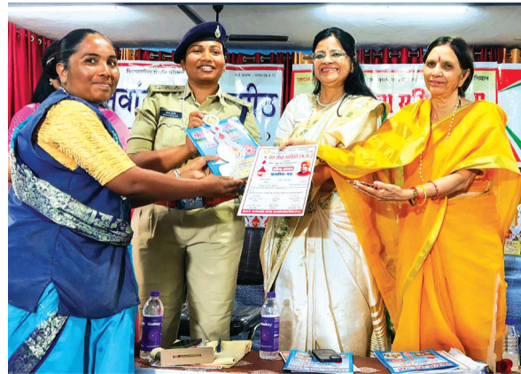
हरिभूमि न्यूज गंजबासोदा

बासोदा रक्त सेवा समिति के रजत जयंती वर्ष के अंतर्गत डॉल्फिन स्कूल में रक्तदाता एवं मातृशक्ति प्रतिभा सम्मान समारोह का आयोजन किया गया। इस कार्यक्रम में रक्तदान करने वाली महिला शक्ति व विभिन्न क्षेत्रों में उल्लेखनीय सफलता अर्जित करने वाली महिला शक्ति को उत्कृष्ट पुरस्कार से पुरस्कृत किया गया। इस