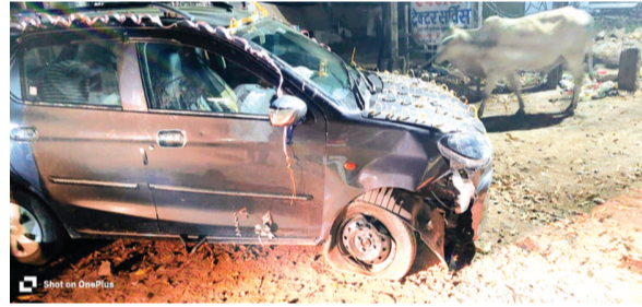
हरिभूमि न्यूज गंजबासोदा

शनिवार को रात्रि के समय त्योंदा रोड अरिहंत नगर मुख्य द्वार के पास एक अल्टो कार दुर्घटनाग्रस्त हो गई। कार के दुर्घटनाग्रस्त होते ही उसके एयर बैग भी खुल गए तथा अगला हिस्सा बुरी तरह से क्षतिग्रस्त हो गया और आगूल फैल गया। प्राप्त जानकारी के अनुसार कार बारात समारोह में शामिल होने आई थी। कार में दूल्हा नहीं था कुछ परिजन बैठे हुए थे, जो सभी सुरक्षित बच गए। प्राप्त जानकारी के अनुसार बारात नटेंरन तहसील के ग्राम निपनिया से नगर में आई हुई थी। बताया जाता है कि कार सड़क पर बने डिवाइडर से जा टकराई थी। डिवाइडर के कट पाइंट पर रेडियम पट्टी न लगी होने और सड़क पर पर्याप्त रोशनी न होने से यह हादसा हुआ। ऐसे हादसे पूर्व में भी हो चुके हैं। नागरिकों एवं वाहन चालकों ने नपा प्रशासन से डिवाइडर पर रेडियम पट्टी लगाने और सड़क पर स्ट्रीट लाइट लगाने की मांग की है।